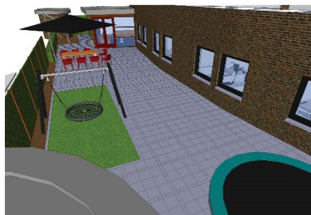
ontwerp tekening van de tuininrichting

Nieuwsgierig geworden, loop over een poosje gerust eens binnen om te kijken hoe het allemaal geworden is. Wel graag even een belletje of het gelegen komt.